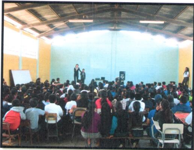
Guatemala, San Pedro Ayampuc. Jornada Matutina. EORM No.887