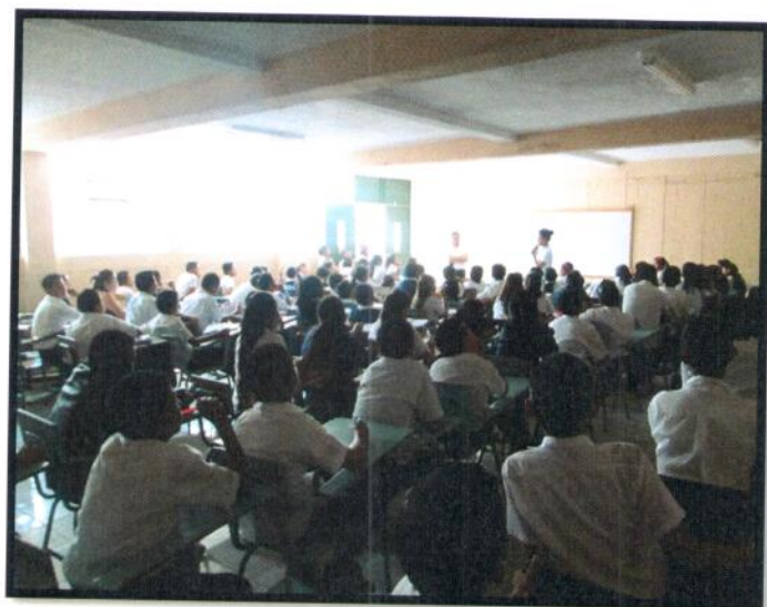
Guatemala , Chinautla Jornada Vespertina. EOUM No. 931