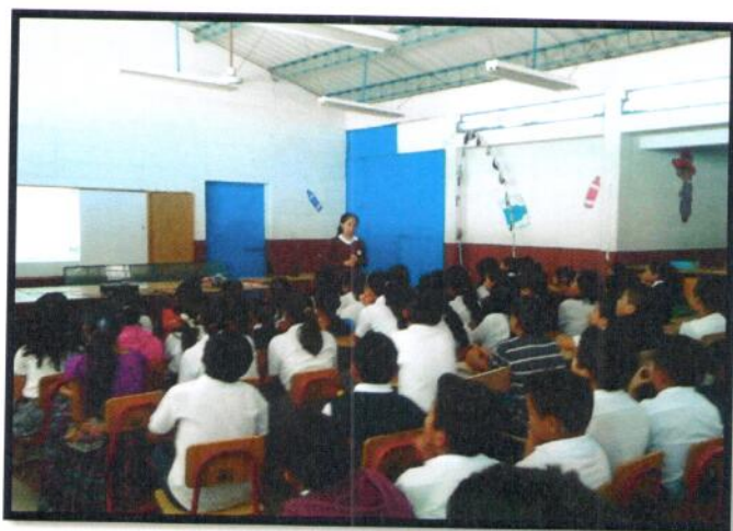
Guatemala, Chinautla Jornada Matutina. EOUM Josefina Alonzo Martínez.