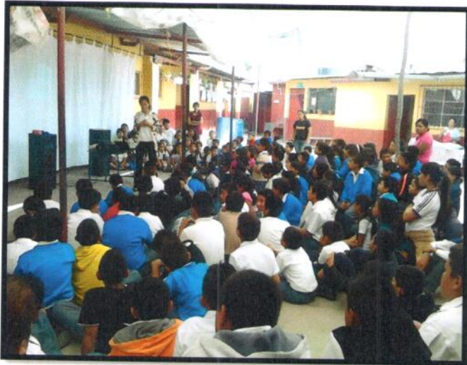
Guatemala, San Pedro Ayampuc. Jornada Matutina. EORM No. 1880