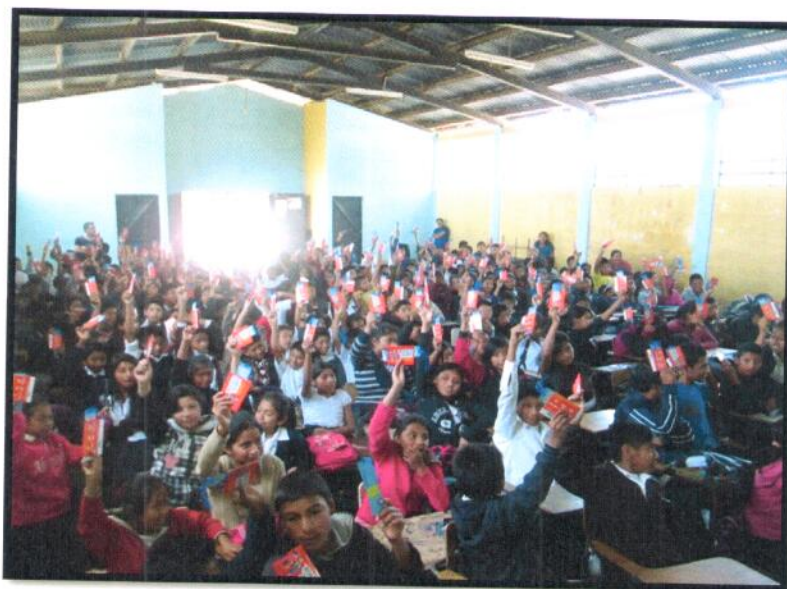
Guatemala, San Pedro Ayampuc. Jornada Matutina. EORM No.887