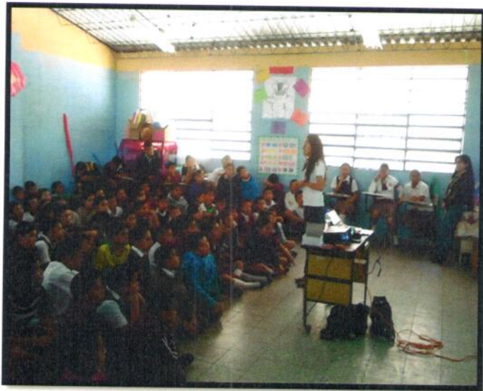
Guatemala, San Pedro Ayampuc, jornada Matutina. EORM Colonia la Leyenda, Aldea lo de