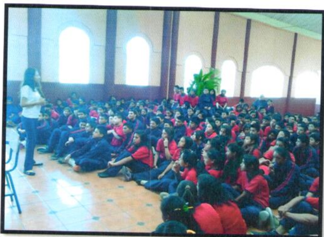
Guatemala, Chinautla Jornada Vespertina. INEB Brenda Elizabeth del